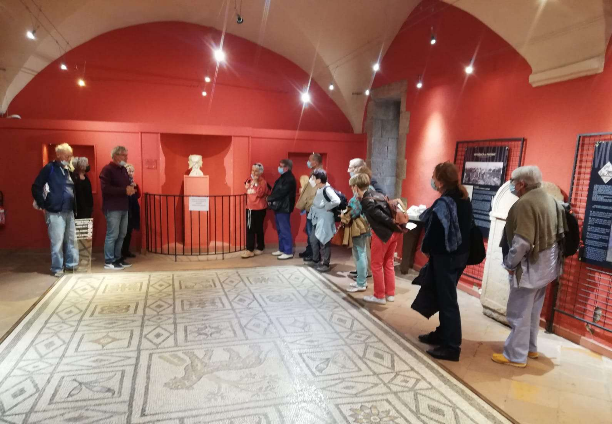
Dans le musée archéologique, les yeux fixés vers « l'Hermès »